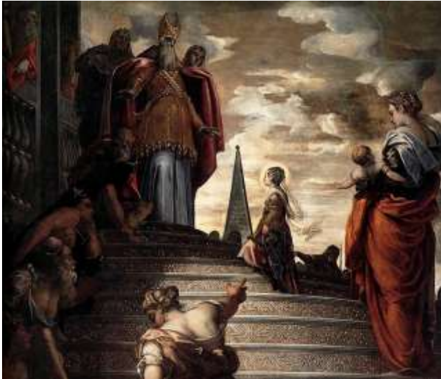
דימויה של מרים (מריה) אמו של ישו מוצגת בבית המקדש, פרט בציור 'הצגתה של הבתולה' של ג'אקופו טינטורטו (שמן על בד, 1553-1556)

איזכור נוסף לכך שמלאכת אריגת הפרוכת נעשתה בידי בתולות מופיע בטקסט האפוקריפה הנוצרי המכונה הפרוטואוונגליום של ג'יימס, חיבור פסיבדואפיגרפי קדום המתוארך לאמצע המאה השנייה לספירה ומיוחס לג'יימס (יעקב), אחיו של ישוע. מסופר בו על מריה, אמו של ישוע, שהייתה בין הנשים שנבחרו לארוג את פרוכת המקדש. למעשה, לפי המסורת שלפנינו, היא הייתה עסוקה במלאכה זו, כאשר התגלה אליה המלאך גבריאל ובישר לה על לידתו הצפויה של בנה. 21 וכך נאמר שם: