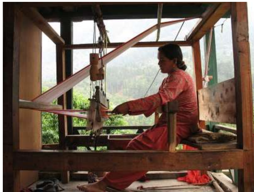
אישה טווה אריג בכפר יארי בצפון הודו (2006)

טיטוס הרשע, שחירף וגידף כלפי מעלה מה עשה? תפש זונה בידו ונכנס לבית קדשי הקדשים והציע ספר תורה ועבר עליה עבירה ונטל סייף וגידר את הפרוכת ונעשה נס והיה דם מבצבץ ויוצא וכסבור הרג את עצמו (בבלי, גיטין נו ע"ב). 51