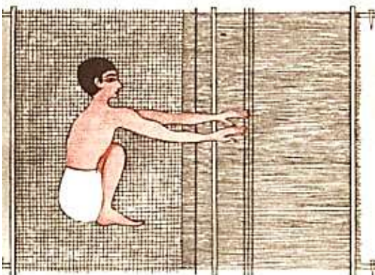
דימויי נשים אורגות במצרים העתיקה שנמצאו בקבר בני חסן במצרים

אולי תיאור זה בא על מנת להרגיע את מי שעומדים בפני בדיקה גופנית, שבוודאי אינה נעימה, ועל כן המשנה מסבירה את תנוחת הגוף של הנבדקים כתיאור של תנוחות גוף שגרתיות.